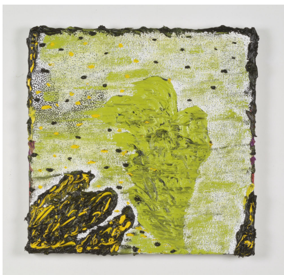
Little Richard Painting, 2006 Olieverf, acryl en potlood op linnen 60 x 60 cm

In 1989 exposeerde hij voor het eerst in het Joods Historisch Museum. Daar maakte hij een indrukwekkende loofhut die bestond uit zeven, aan beide zijden beschilderde panelen. Zijn werk bevindt zich ondermeer in de collectie van het Stedelijk Museum in Amsterdam, het Joods Historisch Museum en de Akzo Nobel Art Foundation. Voor het nieuwe kindermuseum van het Joods Historisch Museum maakte hij recentelijk drie grote voorzetramen met als uitgangspunt de Kabbalistische Levensboom met de tien Sefirot.